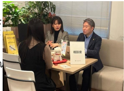
スタートアップカフェでの相談の様子

中: 福岡市がグローバル創業特区 注1 になったことでスタートアップ企業を応援する目標を掲げ、弁護士、税理士、司法書士、弁理士、行政書士、日本政策金融公庫の方が相談にあたっています。Fukuoka Growth Next(旧大名小学校跡地)で毎週木曜日18時から20時まで完全予約制で行われています。起業アイデアが固まった方が開業に向けて専門家に相談する感じですね。私たち行政書士は、各種許認可や、定款や契約書の作成、在留資格などについての相談に対応し、一人でも多くの起業家が世界に羽ばたけるよう挑戦をサポートしています。