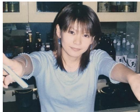
バーでのアルバイト時代

中: そうですね、「何か現状を打破したい」「人生を変えたい」という強い思いでいっぱいでした。「私の人生はこんなじゃない、もっといい人生を歩めるはずだ」という感じで勉強という道に突き進んだ感じです。そこから目の色が変わって絶対に受かるぞ！という感じでしたね。入力の仕事をしながら日曜日に予備校へ通い、合格まで3年かかりましたが勉強はとても楽しかったです。目標ができるってこんなに楽しいんだと、充実していましたし、苦勞して合格を勝ち取ったことで、自信ができました。