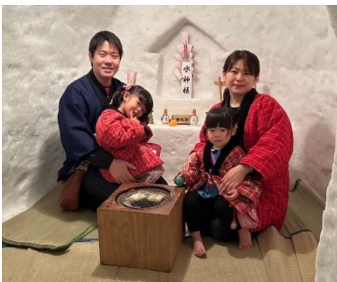
かまくら館にて(秋田県)

中: 旅行は夫婦で大好きです。税理士の夫も20代は勉強詰めでしたし、私も20代は勉強や仕事で生活がやっと、30代は行政書士になっただけでお金も時間も余裕はなく、旅行に行くことができなかったため、旅行に飢えていたわけですよ。今、お互い爆発しているんです。日本全国を制覇する勢いで計画しています。2年後が結婚10周年だから家族全員で海外に行こうかと。目標を持ってお仕事も頑張っています。旅行に行くために仕事している感じですよ。