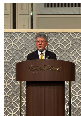
服部誠太郎知事代理 福岡県副知事 江口勝様